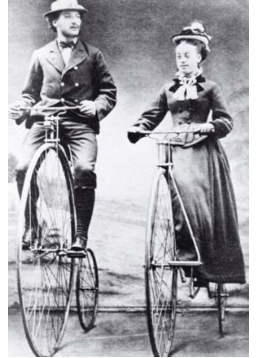
Vers 1872 Lady-Bicycle de la marque Ariel , une construction asymétrique qui permet la conduite en amazone.

Pédaler un tricycle ou un sociable est malgré tout praticable en jupe. En dépit des efforts de dissuasion de leur milieu, les femmes riches s'arrogent, vers 1880, le droit de s'adonner au tricycle.