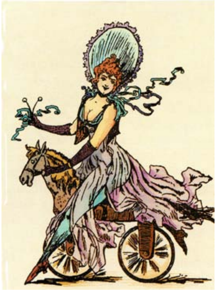
Une «merveilleuse» sur un celerifère lors de la représentation de cette opérette.

A la fin du 18 e siècle, le celerifère, très en vogue, inspire une opérette intitulée "Les Vélocifères", donnée à Paris en mai 1804